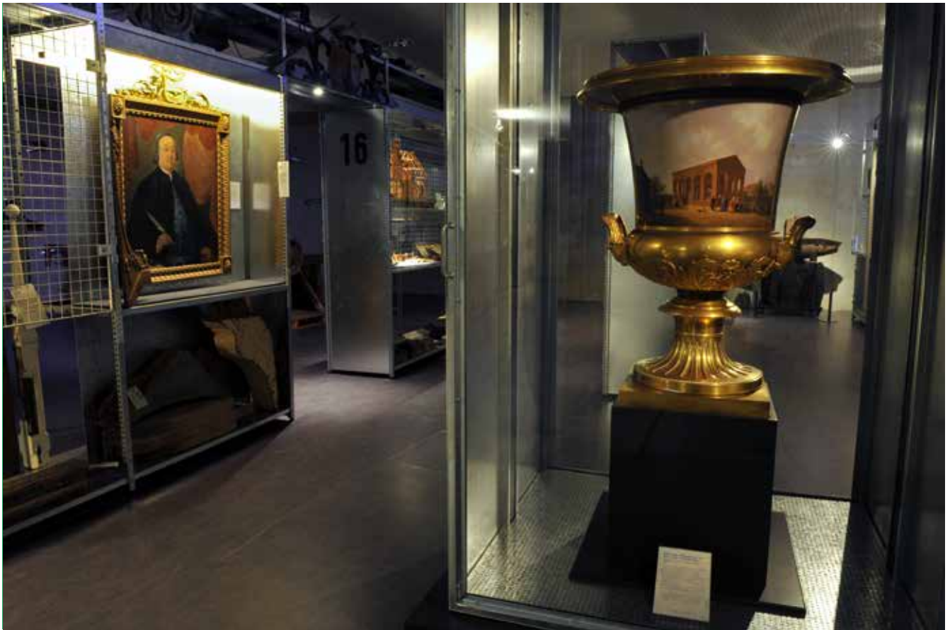
vorm van open depot in Zaans Museum